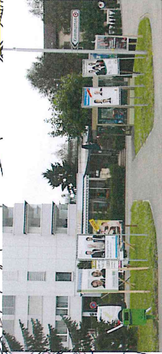
2a Wendschlaufe Zythus, vor Restaurant Rialto

rot= Klapprahmen Gemeinde (Gemeinde stellt auf)