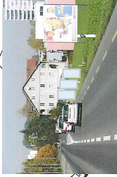
2 d) Luzernerstrasse, nördlich Bushaltestelle Badi Fahrtrichtung Cham, B12 möglich