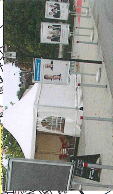
2b) Stadtbahnhaltstelle Zythus, Zugang zum Kiosk, Plakatständer der Gemeinde, Format B4, 5 Klapprahmen doppelseitig, CVP, SVP, SP, FDP doppelseitig Grünliberale und Alternative je einseitig