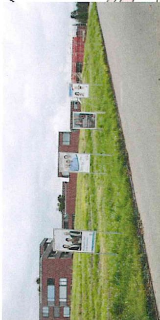
1c) St. Wolfgangstrasse, nördlich Überbauung Rony, Fahrtrichtung Dorf, 5 x B4