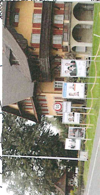
1d) Chamerstrasse, gegenüber Auto Suter AG, Fahrtrichtung Dorf, 5 x B4