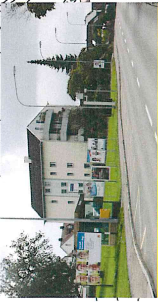
1b) Holzhäuserstrasse, Radarkasten, Fahrtrichtung Dorf, 5 x B4