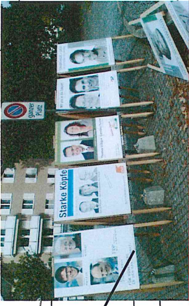
1e) Hünenberg, Dorfplatz, Plakatständer der Gemeinde, Format B4, 5 Klapprahmen doppelseitig CVP, SVP, SP FDP doppelseitig Grünliberale und Alternative je einseitig