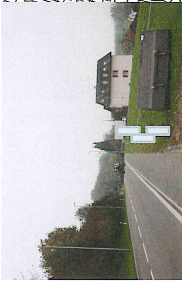
1a) Dräikerstrasse, oberhalb Scheune Leo Luthiger, Fahrtrichtung Dorf, 5 x B4